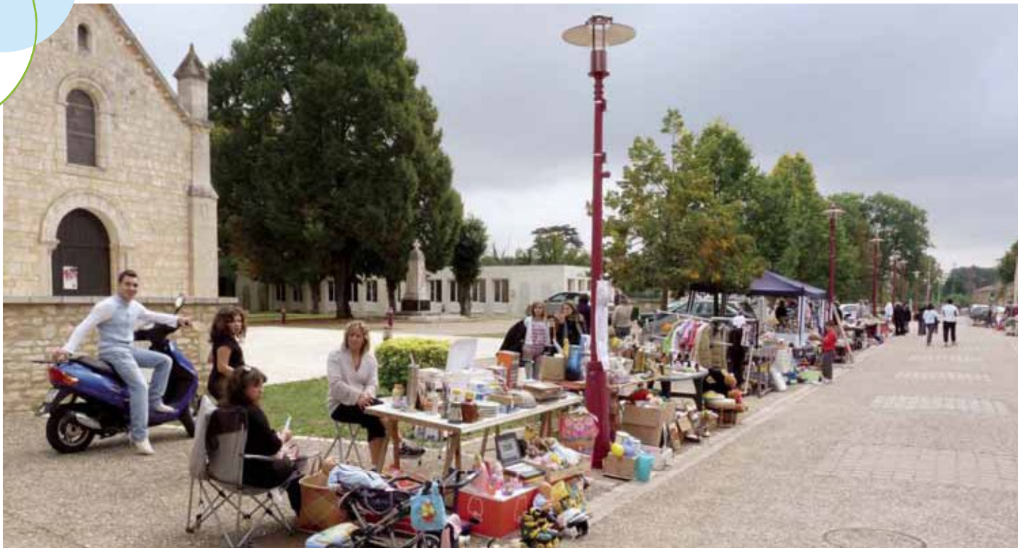
Vide grenier Biard sans Frontières.