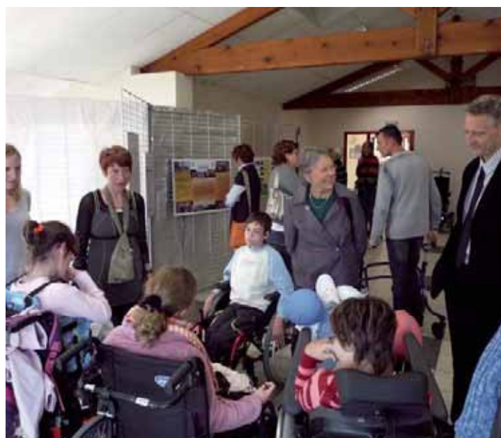
Animation "J'accède" de l'IEM.