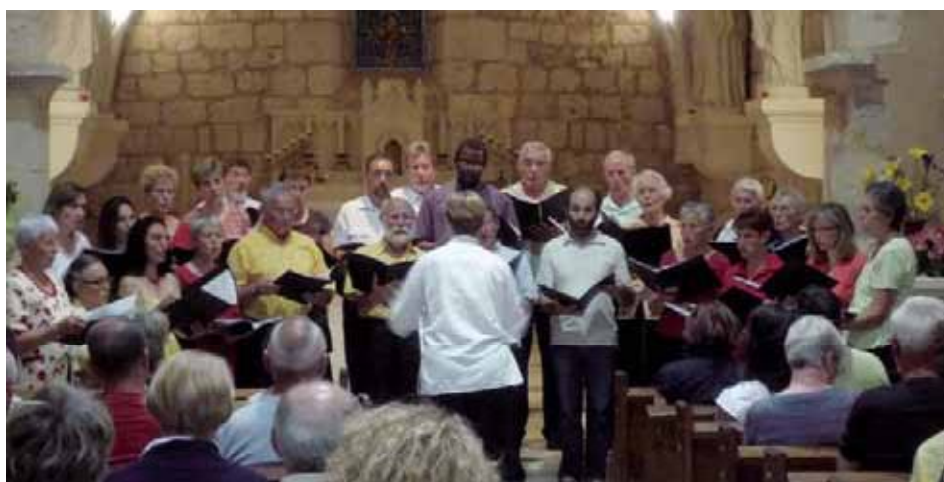
Chorale "Chante la Boivre".