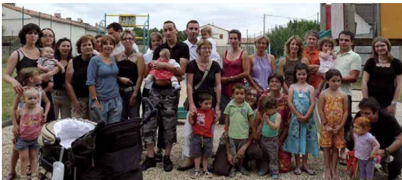
Fête de la crèche "Succe Pouce".