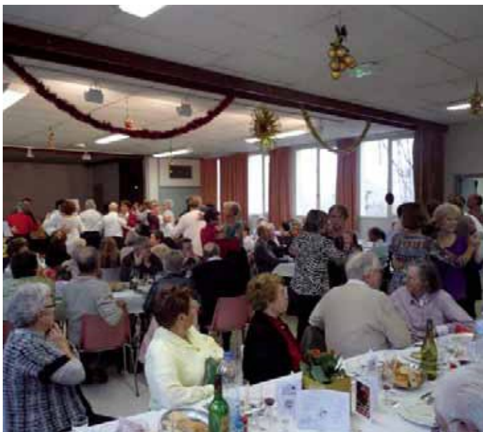
Repas des aînés.