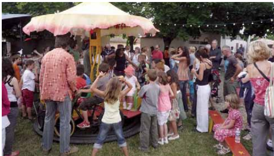
Biard dans les Aïrs.

La richesse d'une ville vient aussi de la multiplicité des actions et des activités proposées par les associations. Ces dernières sont en permanence à la recherche de bénévoles pour les aider dans leur domaine qu'il soit culturel, sportif, humanitaire ou social. C'est une source de découverte, d'échange et de partage où chacun peut trouver un investissement à la mesure de ses disponibilités et de ses savoirs et compétences.